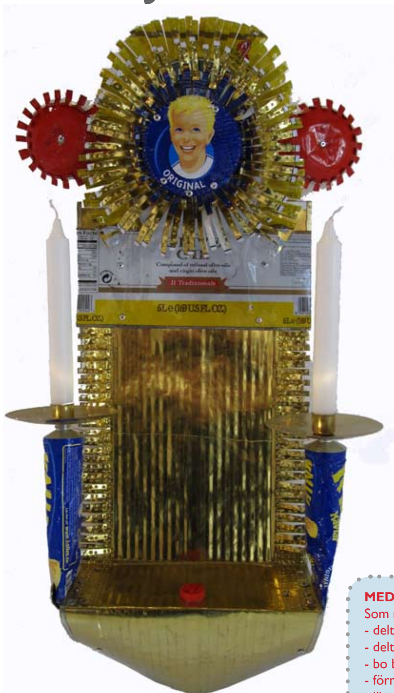
Lampett av Barbro Fagerlind, Stockholm. Missa inte hennes utställning och kurser Re-art – återbruk i plåt och andra material, se sid 4.