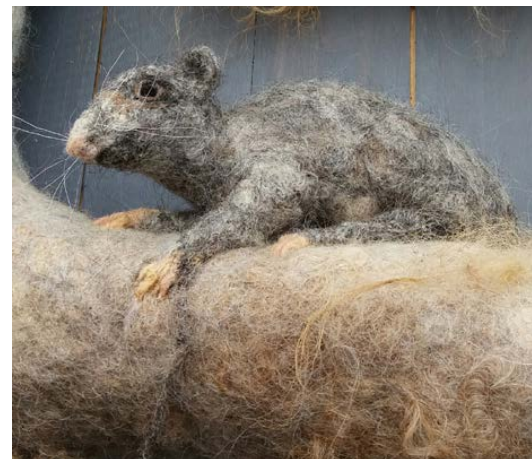
En råtta av tovad ull var ett av alla ting som visades på Ullfestivalen i Sparreholm i år.