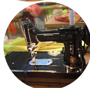
Den gamla symaskinen är från 1930-talet och fungerade utmärkt!