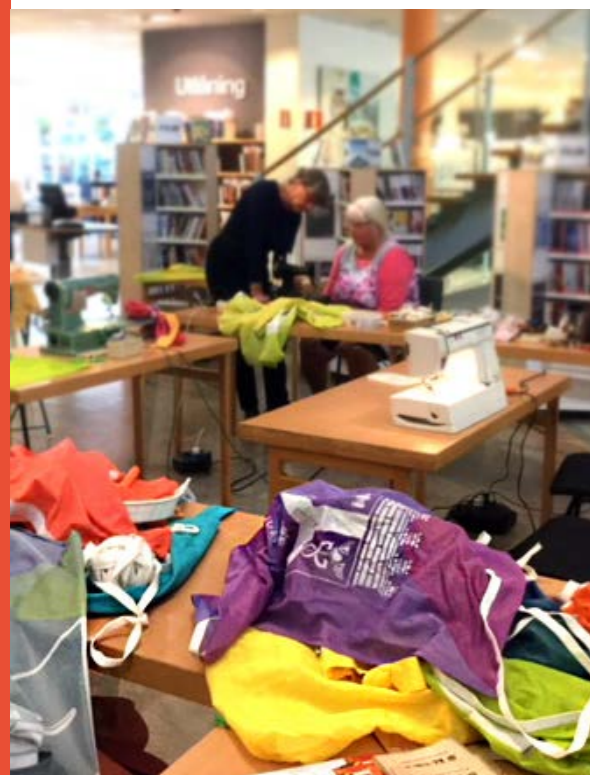
Hemslöjdens Dag firades på biblioteket i Katrineholm, där sybord dukades upp.