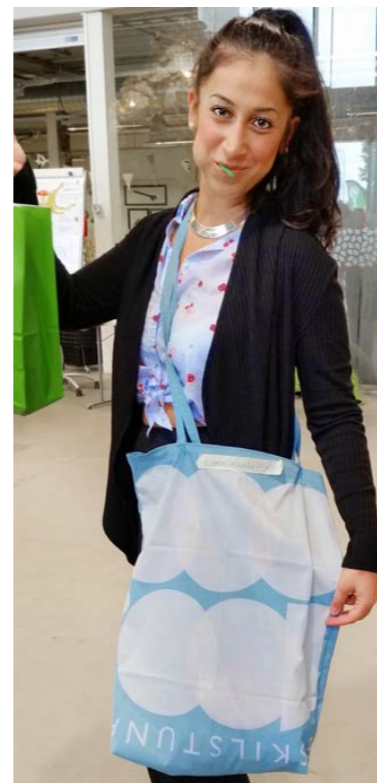
3:e-pristagaren visar upp sin blå egensydda kasse.