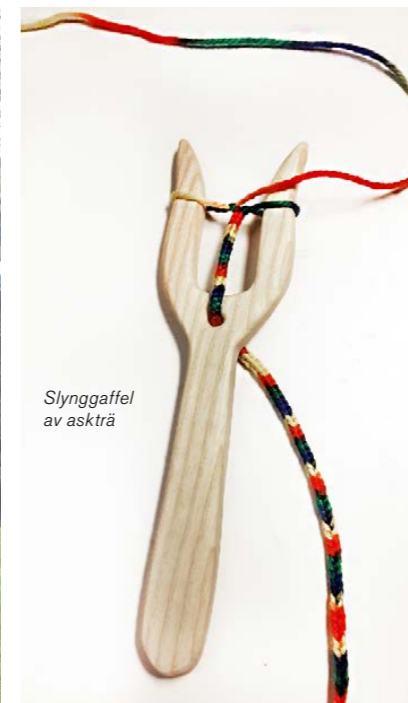
Slynggaffel av askträ