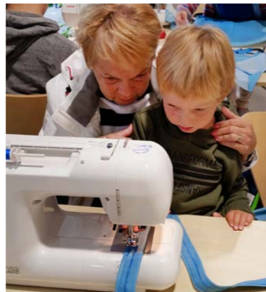
2:a priset gick till deltagare med sitt barnbarn.

Lördagen den 1 september anordnades Hemslöjdens Dag på flera orter i Sörmland. Här visas några av aktiviteterna!