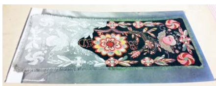
Kolorerat foto av en bonad av Lilly Zickerman.

Materialet är indelat efter landskap, det finns idag 6 planscher som beskriver textilier insamlade från Sörmland. Medan i till exempel