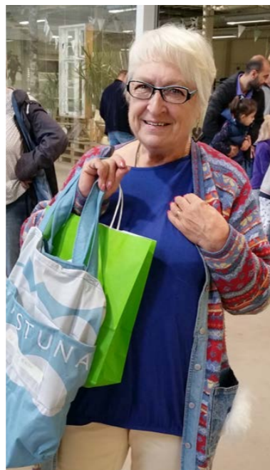
Vinnaren av 1:a priset i Eskilstuna.