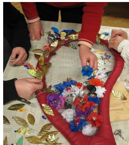
Majstångsmakarna tillverkar löv