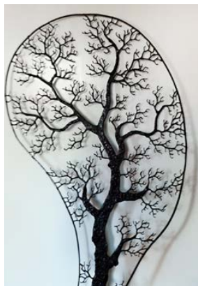
Ett löv från Malmköping, smide av Olle Smed