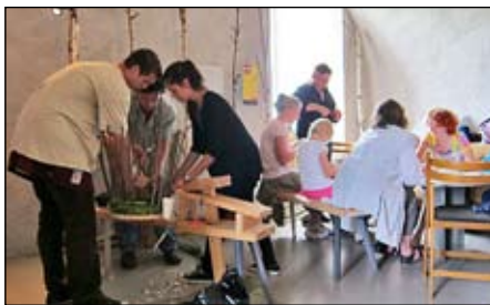
Provapåslöjd under invigningen av utställningen Handkraft Ja Tack!

Med tanke på Hemslojdens stora hundraårsjubileum och de program som är inplanerade finns möjlighet till ett ännu mer händelserikt 2012. Ett axplock av vårens program hittar du i kalendariet på sista sidan. Ett utförligt kalendarium för 2012 kommer i första numret av Handlaget i slutet av januari.