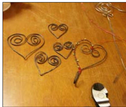
Hjärtan av ståltråd.