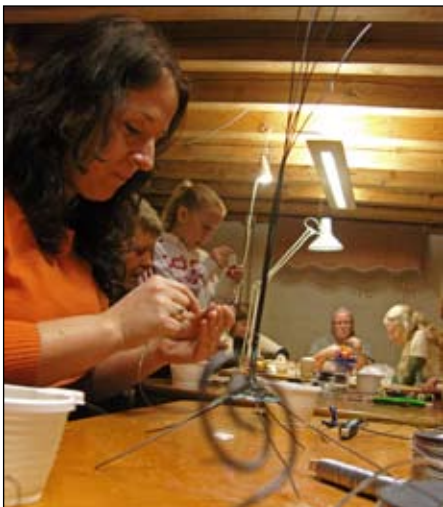
Luffarslöjd och ljusdekorerung var temat för höstens sista slöjdräff på Magasinet i Nyköping.