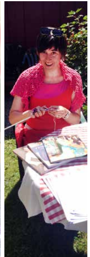
Bergströmska gården, krokning.