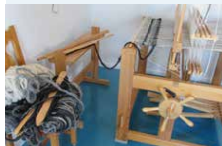
En ullmatta på gång