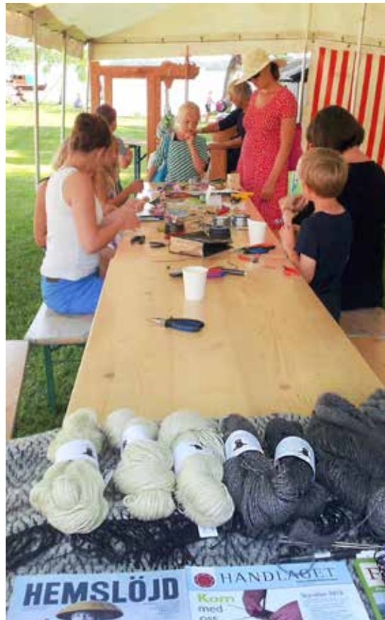
Kreativa marknaden.