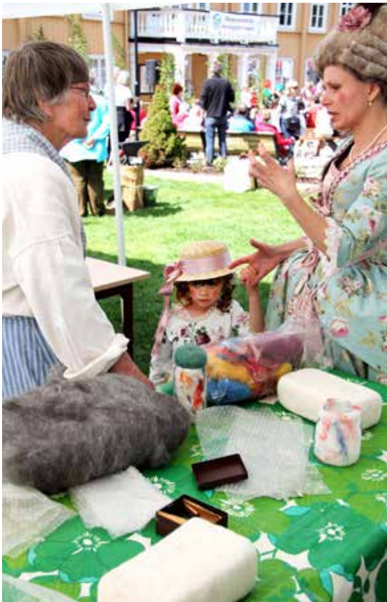
Gammeldags Marknad.