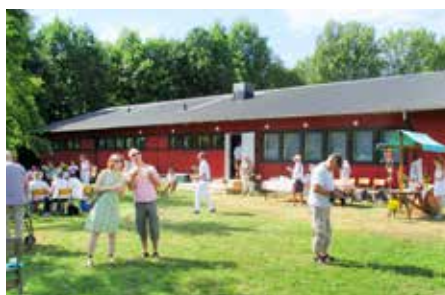
Invigningsdag på Båvens spinnhus