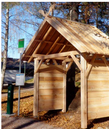
Busskuren vid Vårdinge by folkhögskola, byggd av skolans elever på trähantverk.