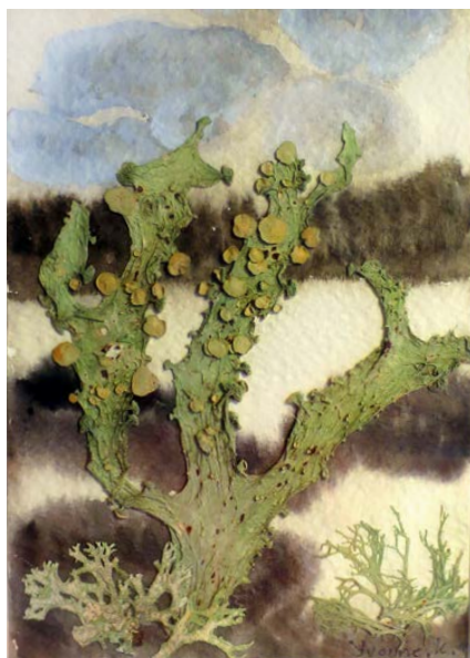
Yvannes akvarell med lavar från naturen.

Under Hemslöjdens dygn på Culturum i Nyköping i september fick vi dela flera olika människors egna erfarenheter av slöjd och återbruk. Ett par av dem som kom förbi och pratade med oss var det glada och pigga paret Björn och Yvonne Klaesson från Stigtomta.