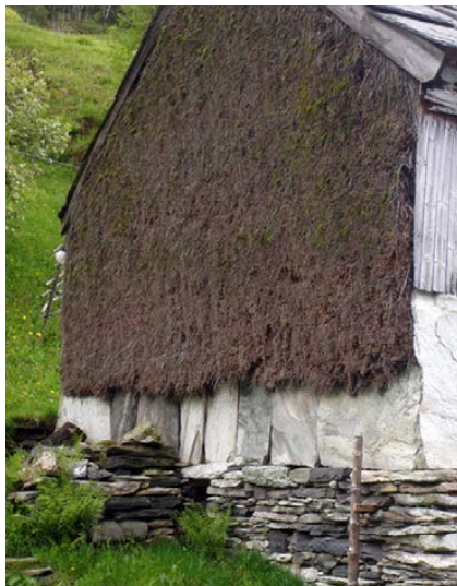
Traditionell vägg till grindbygge. Skiffersten nedtill på vägg och på taket och flätat enris upptill på väggen.