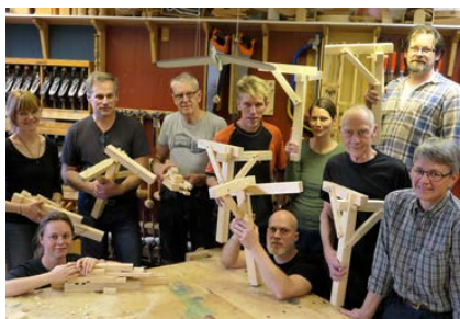
10 av kursens 15 deltagare visar upp varsin knut. Två knutar gör en grind, som hålls samman av stavlegje.