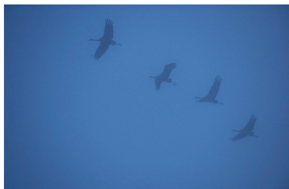
Tranor.

Individuell tävling, där det gäller att under en