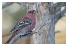
Tallbit – hanne.