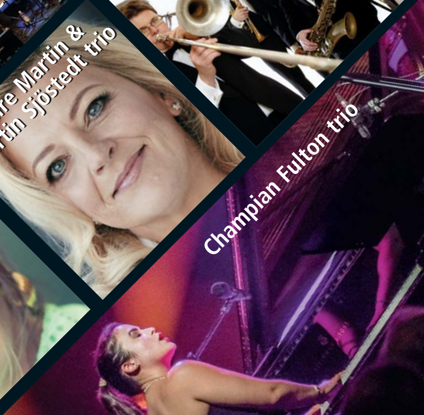
Champion Fulton trio