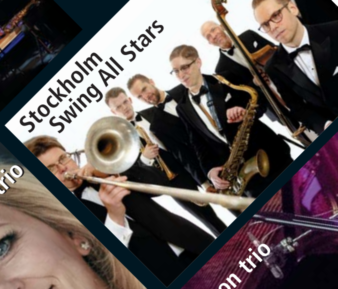
Stockholm Swing All Stars