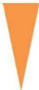
Rakt fram Långsamt