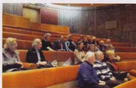
Intresserade westerlundare i hörsalen