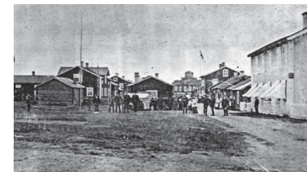
Arvidsjaur's samhälle slutet av 1800-talet