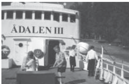
Båtutflykt på Ångermanälven med Ådalen III Släktmötet 2001

betalande medlemmar, däremot kommer det att läggas ut på föreningens hemsida.