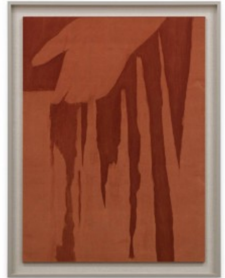
Foto: Galleri Fagerstedt, Hälsingegatan 18. Utställningen pågår 14 januari – 21 februari 2016