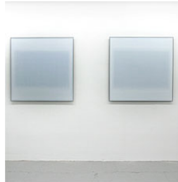
Iron Screen III, IV © Per Kesselmar