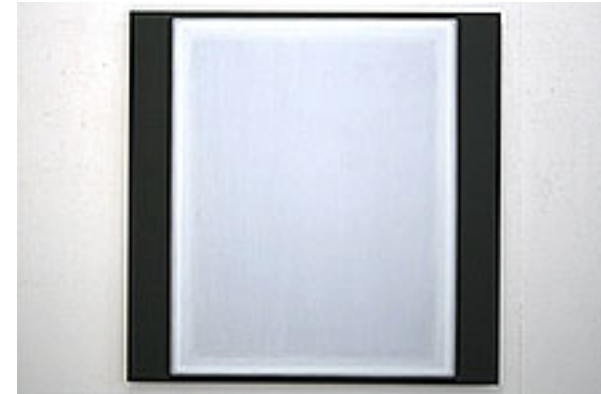
"Screen" © Per Kesselmar

Galleri Fagerstedt, Stockholm | Omkonsts startsida