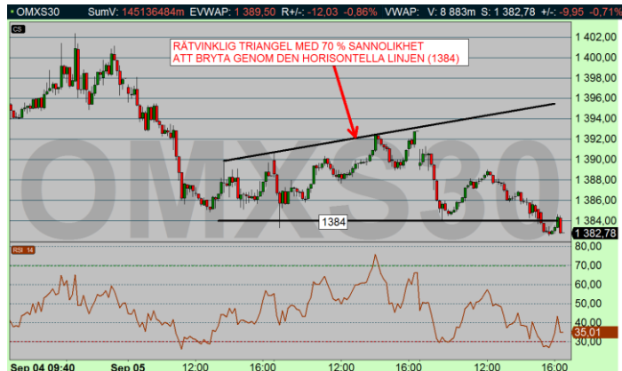
Diagram källa: INFRONT (10 min-diagram)

Sammanfattningsvis: (kvarstår) OMX fortsätter upp mot 1410 denna vecka.