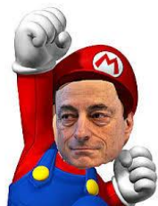
-Ingen fart på räntan varken upp eller ned – 0 % rules ye!