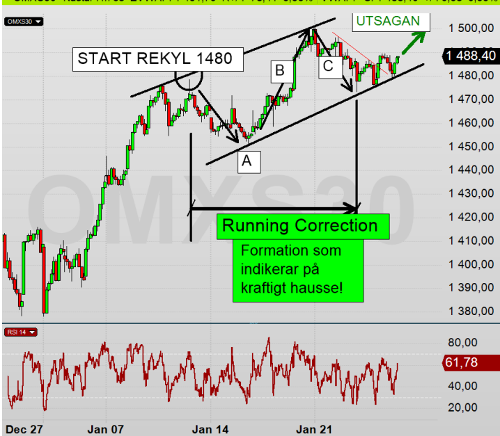
OMX 10 min diagram