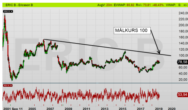
ERIC dagsdiagram: Befintlig köpsignal sedan riktigt långt tillbaka!

Rent tekniskt befinner sig Ericsson i en långsiktig köpsignal på väg upp mot 100 kr.