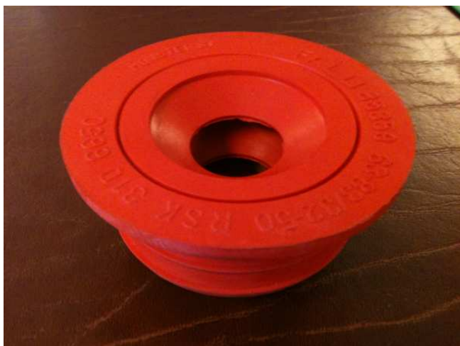
Godkänd muff för köksvattenlås. (finns flera olika godkända)

Om du byter vattenlås i kök eller badrum är det mycket viktigt att du har en anpassad muff mellan ditt vattenlås och gjutjärnsavloppsröret. Vi har flera gånger observerat att plaströret från vattenlåset enbart tryckts ned i gjutjärnsröret och tätats med tätningsmassa.