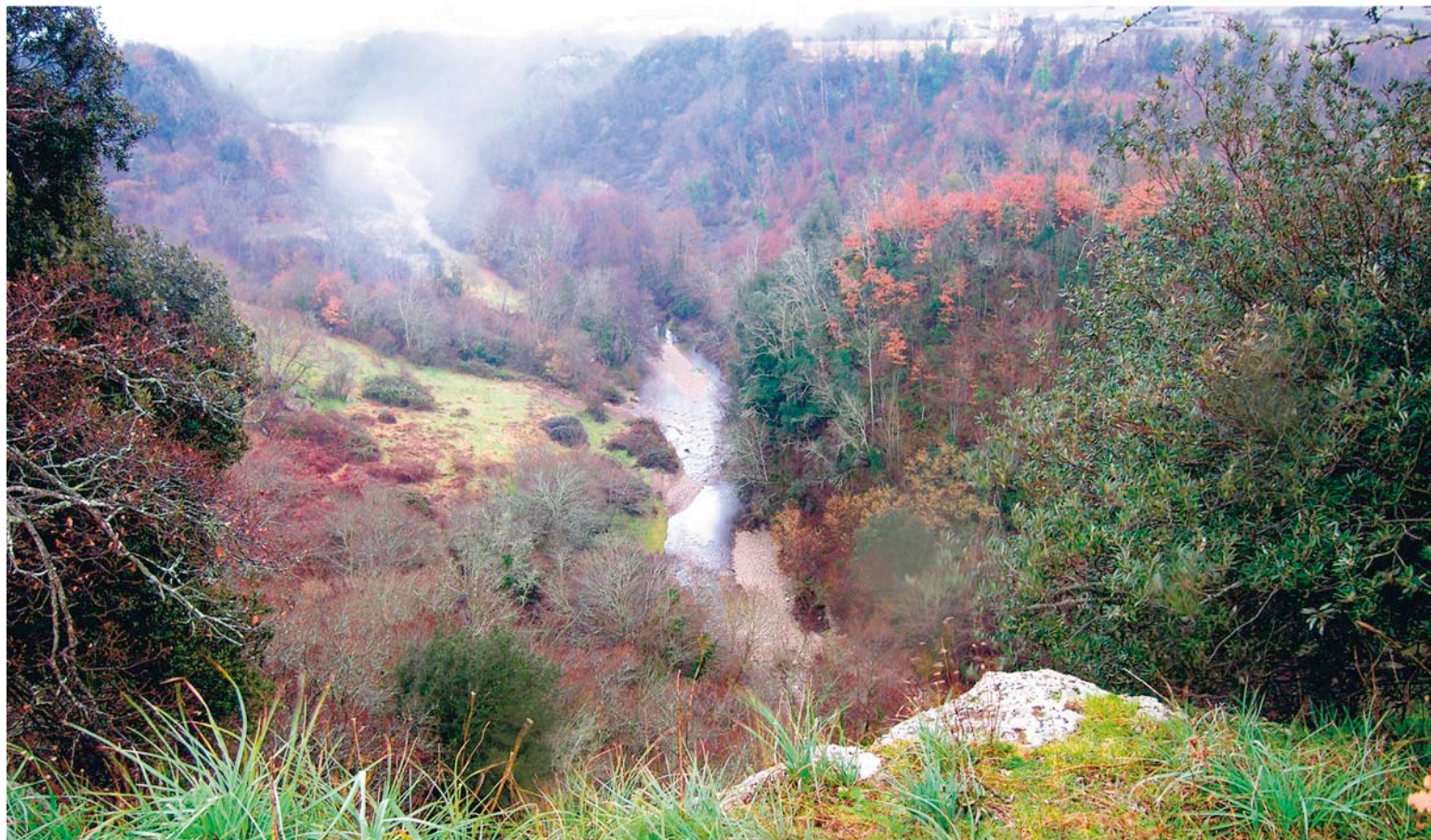
Utsikt från huvudakropolen mot Vignales t.v. och dess omgivningar.