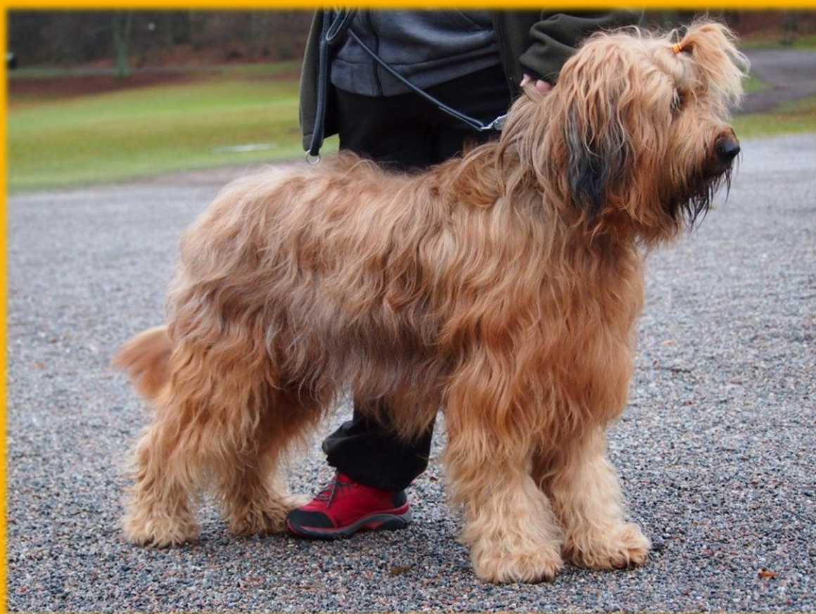
Don Fido's Morr On Rock (e. Don Fido's Polluxx u. Don Fido's Costa del Soul)