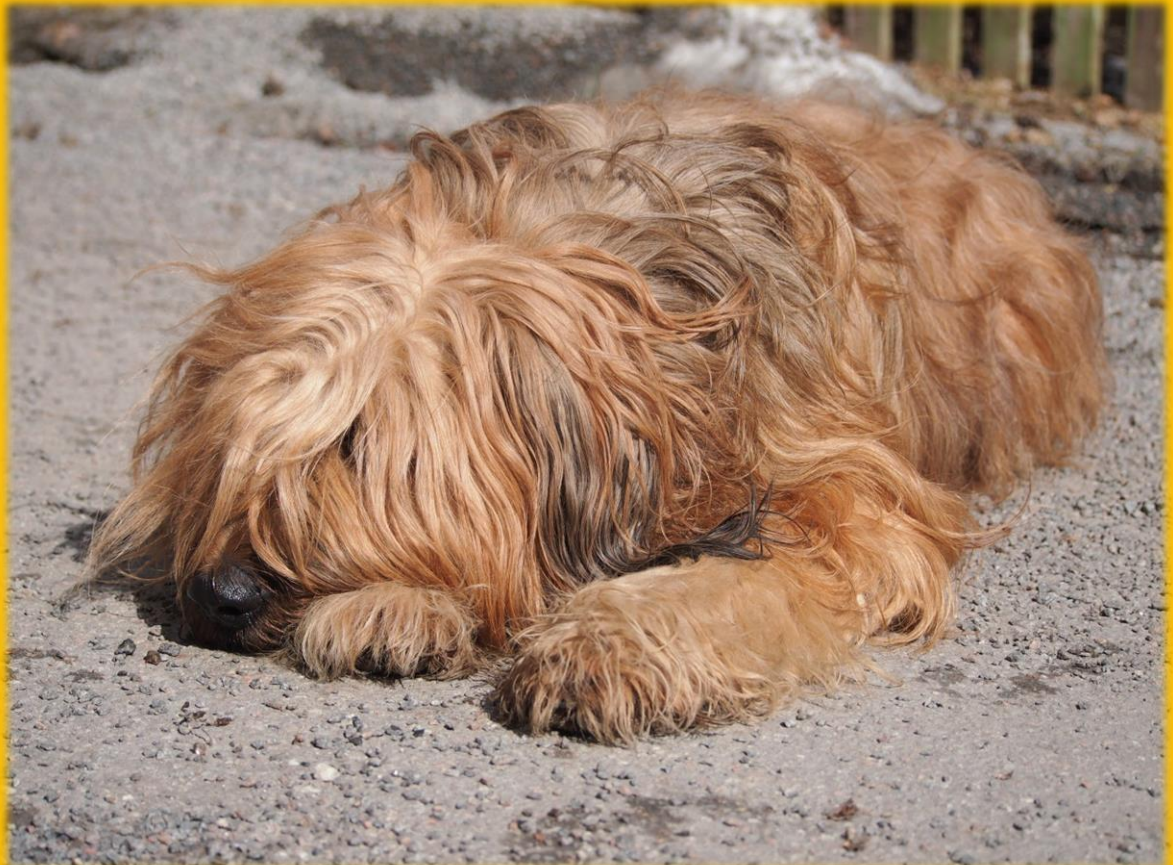
Don Fido's Morr On Rock (e. Don Fido's Polluxx u. Don Fido's Costa del Soul)