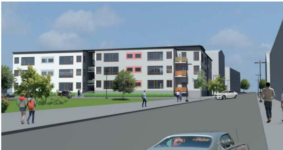
Perspektiv mot väster sett från Finspångsvägen mot Optimusvägen. Illustration av Björk & Nordling arkitektkontor ab.