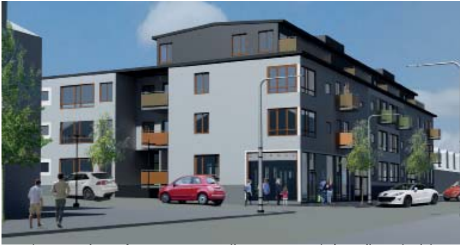
Perspektiv mot söder sett från Optimusvägen. Illustration av Björk & Nordling arkitektkontor ab.