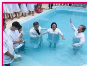
Dop i Teresina.