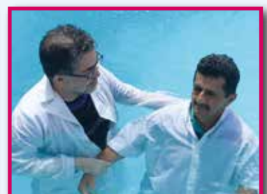
Dop i Teresina.