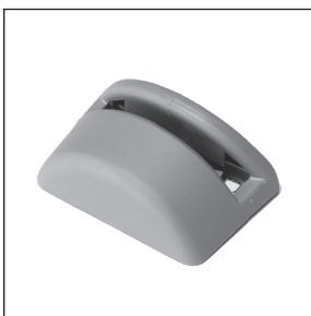
LED-lampa: 44 x 33 x 17 mm

Hyllbelysning (LED) som drivs trådlöst. Lyser upp glashyllor i vitrinskåp, bokhyllor eller köksskåp. Ger ett elegant utseende. Inga hål behöver borraras och belysningen är fri från synliga sladdar.