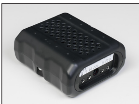
Kopplingsbox: 120 x 104 x 55 mm