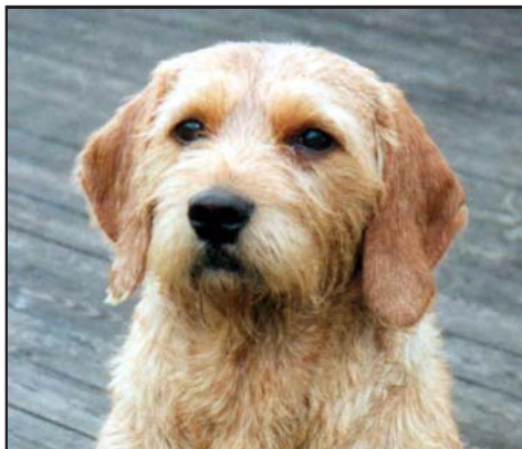
Flata öron och för högt ansatta.

Det kan ibland förekomma bortfall av andra tänder.