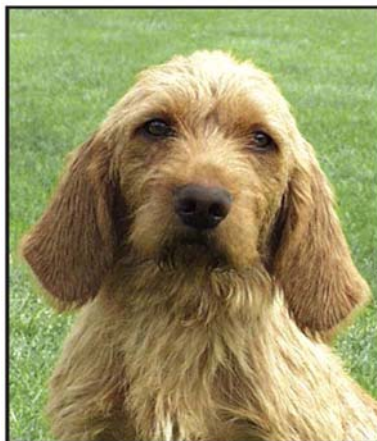
Korrekt ansatta öron.

Halsen skall vara kort, dock måste den vara av tillräcklig längd för spårfunktion.