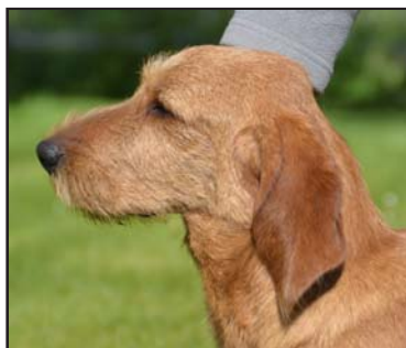
Utmärkt huvud och öron

Huvudet/hjässan får aldrig vara platt/flat. Den franska originaltexten beskriver skallen/hjässan som "galgformad" när du tittar på hunden framifrån.