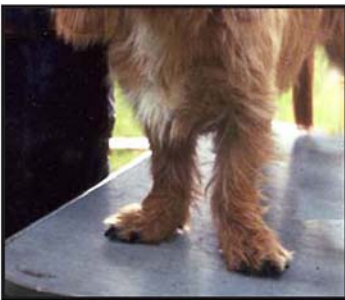
För fransysk front.