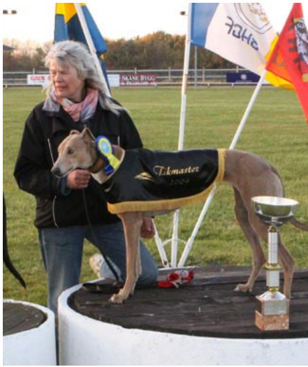
Tikmasters, segrare Titan Buff, My Leffler, SHS.

Övriga nominerade: Athenas Pearl, Concorde, Mystic Moon, Roma, Toxic Tea Fairy.