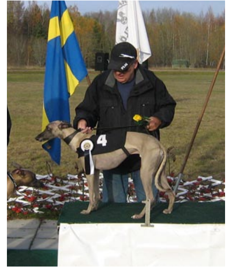
AxRace's Banana Split, VHS vann Domar Race och blev även Årets Hässlövhund 2009.

Förklaringen till att just Banana Split är Årets Whippet sitter enligt husse i huvudet. Desto mer jaktvilja desto bättre hund, säger han. Och Banana Split har jakt så det räcker och blir över. Sen har han ju en lång rygg som ger honom ett bra steg också men mest sitter det nog ändå i huvudet, funderar husse vidare.