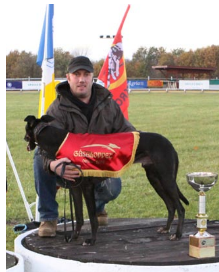
Gåsaloppet, segraren Apollons Pearl.

han fått ställa sig på andra platsen har va- rit till förmån för sin bror, Hades Pearl.