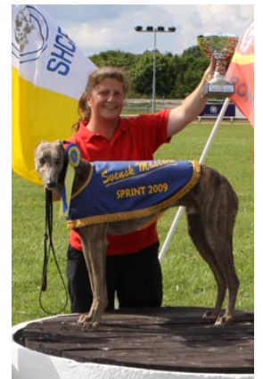
Sprint SM, segraren Crimdon Boa.

Crimdon Boa debuterade i juni och hann under året med tio starter. Utav dem var sex segrar och bara vid ett enda tillfälle