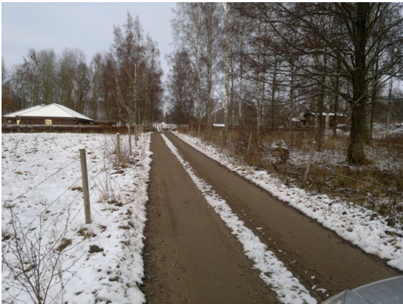
Vägen upp mot Ängarås. Fastigheten Ängarås 3:3 med villan väl anpassad till naturen på vänster sida. Foto Kent Friman, 2013-nov, copyright och med publiceringstillstånd från ägarna