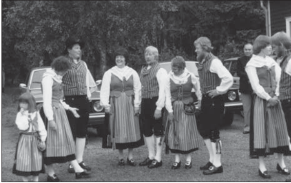
Ljungstorpsdräkten växte fram vid träffar i bygdegården.

40 år. En väldans många år i en förenings totala existens. 1965 samlades ett antal Ljungstorpare och beslutade att bilda en förening och samtidigt införskaffa en lokal. Historien om köpet av en barack i Karlsborg, vilken fick agera samlingslokal och som sedan under årens lopp förbättrats, byggts ut och byggts om, är en klassiker vid det här laget.