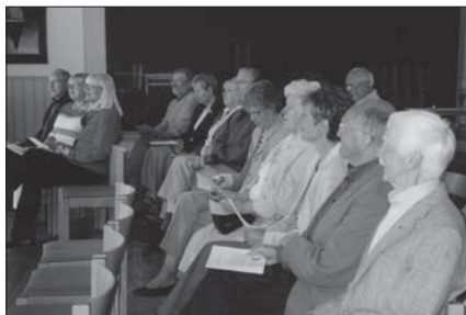
Gudstjänstbesökare i bygdegården.