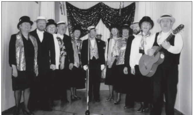
Revygänget hälsar publiken välkommen.