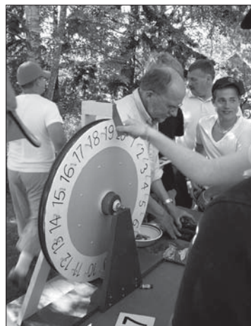
Spel och lekar är ett måste på midsommar i Ljungstorp!

Avslutningsvis serverades kaffe och bakelse inne i bygdegården.