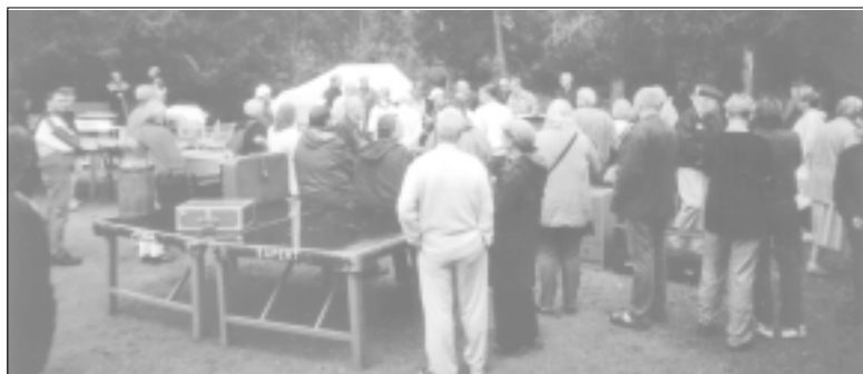
Under regntunga skyar gjordes många fynd.

Tyvär visade vädergubbarna sin sämsta sida den här dagen och ett duggrezn föll över de stora möbler som stod uppställda på bygdegårdens parkering. Föremålen täcktes med presenning vilka plockades av vartefter försäljningen pågick. Lars-Göran Pettersson höll dock modet uppe och föremål efter föremål ropades ut. Inomhus var alla mindre föremål uppställda. Många fynd gjordes säkert den här dagen.