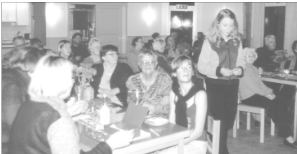
En trivsamt fredagskväll – höstauktion i Ljungstorp.