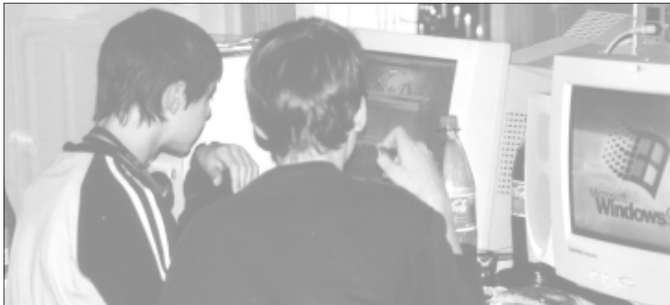
Dataintresset var stort. LAN-partyt pågick i 32 timmar.

Bygdegården är till för Ljungstorpsbor i alla åldrar. Med den här sortens arrangemang vill bygdegårdsföreningen visa ungdomarna att även de kan ha glädje av Ljungstorps Bygdegård.