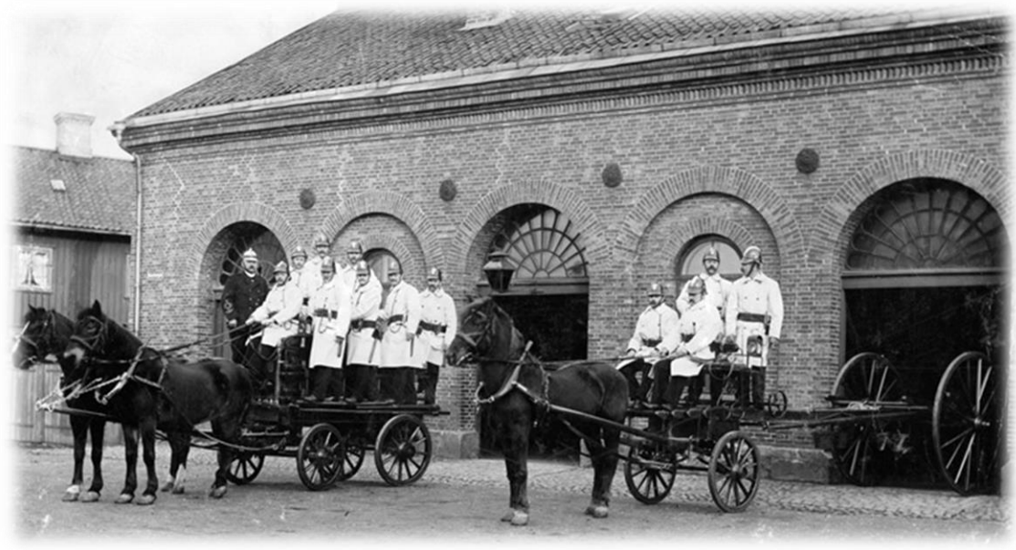
Majornas brandstation, vid Kusttorget Tillkom då Majorna införlivades med Göteborg 1868.

Det är vår önskan att du nu vill stödja Museiföreningen då det är dags att betala medlemsavgiften.