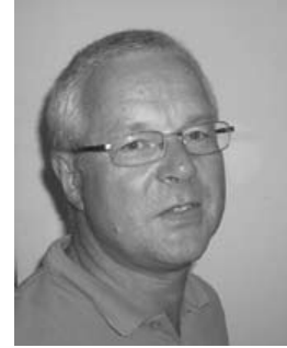
Av Bo Hultén