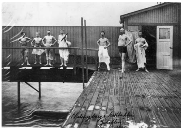
Kallbadhuset 1907. Platsen där det hela började.

Liksom för alla andra simföreningar vid den här tiden var det promoveringarna och dess underliggande simskolor som var den stora uppgiften för Helsingborgs Simsällskap. Det var först i slutet av 1910-talet som simidrotten