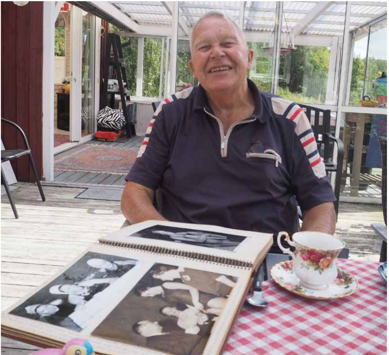
Sommaren 2018 berättas det simmningen i hemmet i skånska Utvälinge.