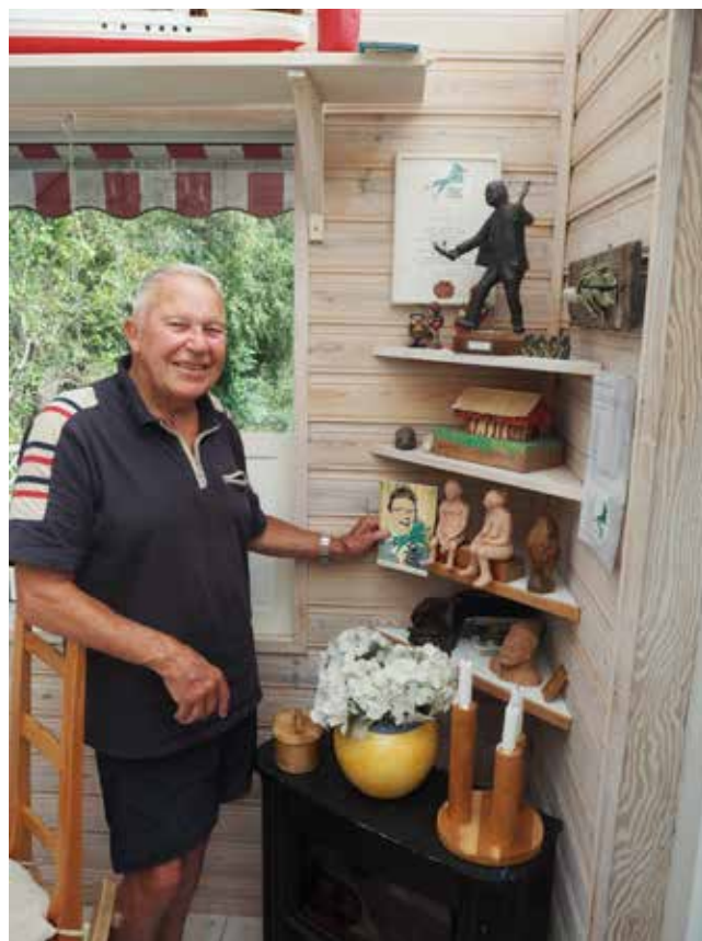
Konstnärliga ådran märks i hemmet vid Skälderviken.

Dagen efter vårt möte hade han på programmet ett stort släktemöte i egna huset. Långaväga kusinen