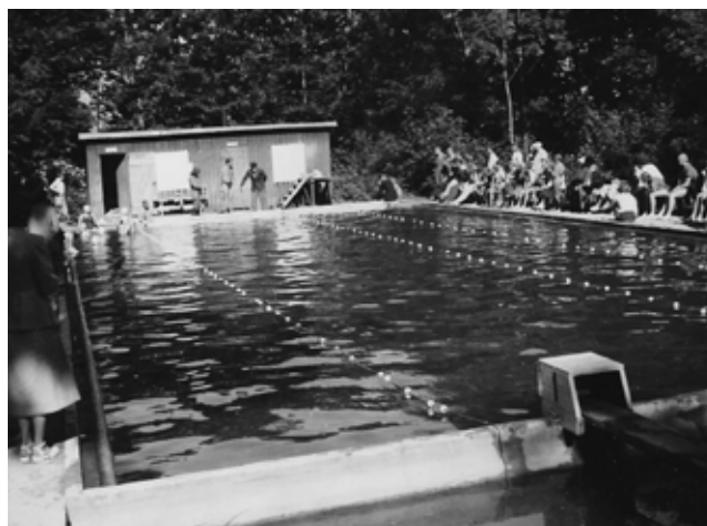
Simbassängen i Forsakar, Degeberga är numera uppgjuten, 50 meter lång och enligt gängse normer. Då på 50-talet, handgrävd med träkanter, 25 meter och inte speciellt djup men ändå flockades danska och svenska landslagssimmare här för träning och som på bilden klara för tävling.

Om minnesvärda träningsläger kan han berätta