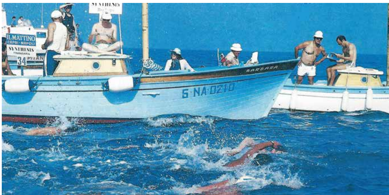
Följebåtar, langning och säkerhet är viktigt runt långdistanssimningarna. Här en solig och lugn dag mellan Capri och Neapel.

tjänade några korvören på denna insats. Väl på plats i Egypten visade det sig att tävlingen i Nilen inte var något som man skojade bort. Vattnet där på 1950-talet var kanske inte det allra renaste.