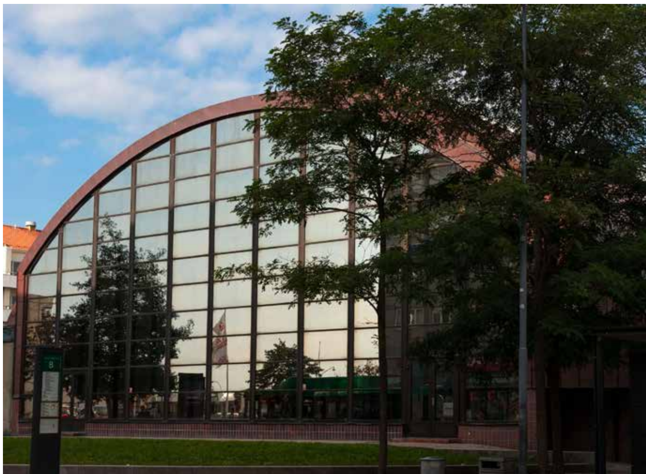
Simhallsbadet på Södergatan är fortfarande i drift och ses här med sin klassiska siluett.

upptogs träningen igen, men den här gången var det med betoning på judo och karate. Klorlukten höll han borta länge, mycket länge.