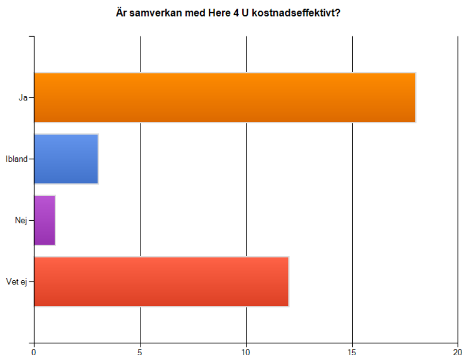
Diagram 3: Effektivitet

20,9% (9 personer) valde att inte besvara frågan, 7 % (3 personer) svarade ibland, 41,9 % (18 personer) svarade att ja de ansåg samverkan vara kostnadseffektivt, 2,3 % (1 personer) svarade nej och 27,9% (12 personer) ansåg att de inte var säkra.