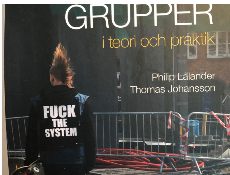
Några av våra kursböcker.

Om det är något du vill ska belysas i detta medlemsblad, om du har några frågor eller om du vill ha mer information, kontakta: