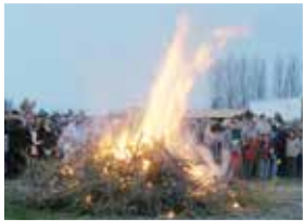
Traditionellt Valborgsfirande 30 april