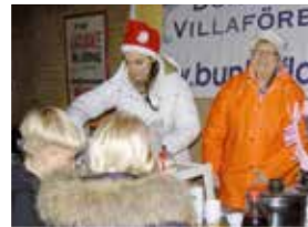
"Mitt Bunkeflostrand" vernissage 29 november