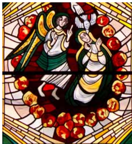
Bebådelsen. Glasmålning i Sankta Marias kyrka i Heliga Hjärtas Kloster