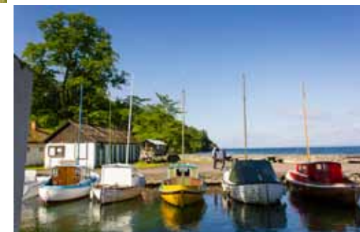
Hamnen i Borghamn

nedanför Omberg vid Borghamn. Klosterkyrkan i Vadstena byggdes i slutet av 1300 talet och början av 1400-talet av kalksten därifrån. Nu finns i Borghamn affär och vandrarhem.