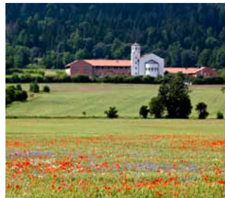
Heliga Hjärtas Kloster

Du får vandra upp på berget Omberg. Överallt på jorden finns det heliga berg. Att komma upp på ett berg kan ge oss en känsla av att komma närmare det höga, det heliga. Kanske får vi också en förnimmelse av överblick över våra egna liv. Vid Västra väggar kan du högt över Vätterns vattenyta se långt, se konturerna av Västergötland. Och kanske ana något av skapelsens storhet, den ständigt pågående skapelsen, där du som människa har en uppgift.