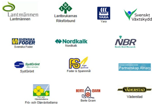
Figur 3. Under 2019 var det 13 stycken intressenter som anslog medel och samverkade med OiB på olika sätt.