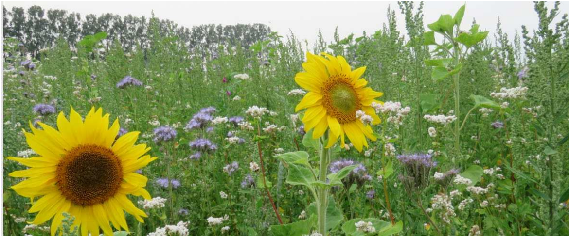
Figur 4. Ett flertal tester med odlingar av SamZoner har skett under 2019. Erfarenheter dokumenteras och en början till hjälpreda har tagits fram. Här ses en odling av en ettårig blandning för att gynna insekter och fåglar.

studerats och analyserats. Det har resulterat i ett förslag till förändrat regelverk för att SamZoner ska ge bättre funktioner och anpassas till lantbrukarnas situation. Förändringsförslagen har kommunicerats med myndigheterna.