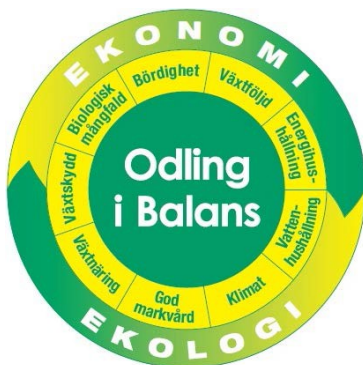
Figur 1. Ekonomi och ekologi i balans är Odling i Balans motto. Föreningen arbetar utifrån ett helhetsperspektiv inom jordbruket, med frågor om god markvård och bördighet, minskad klimatpåverkan, vatten- och energihushållning, balanserad växtnäringstillförsel, skydd och främjande av biologisk mångfald, goda växtföljder och ett integrerat växtskydd.

År 1991 registrerades Odling i Balans (OiB) som ideell förening. OiB syfte är att utveckla svensk växtodling så att ekonomi och ekologi är i balans utifrån ett helhetsperspektiv. I figuren nedan visas de områden som OiB verkar inom. OiB verkar och driver utvecklings- och forskningsprojekt tillsammans med experter, forskare och lantbrukare. Det största projektet under 2019 har varit SamZons-projektet, ett EIP-AGRI innovationsprojekt ( European Innovation Partnership for Agricultural productivity and Sustainability ), inom vilket flera av OiB arbetsområden har berörts eftersom det handlar om att utnyttja en yta för flera olika funktioner. Nedan följer en berättelse om OiB verksamhet och de projekt man arbetat med under 2019.