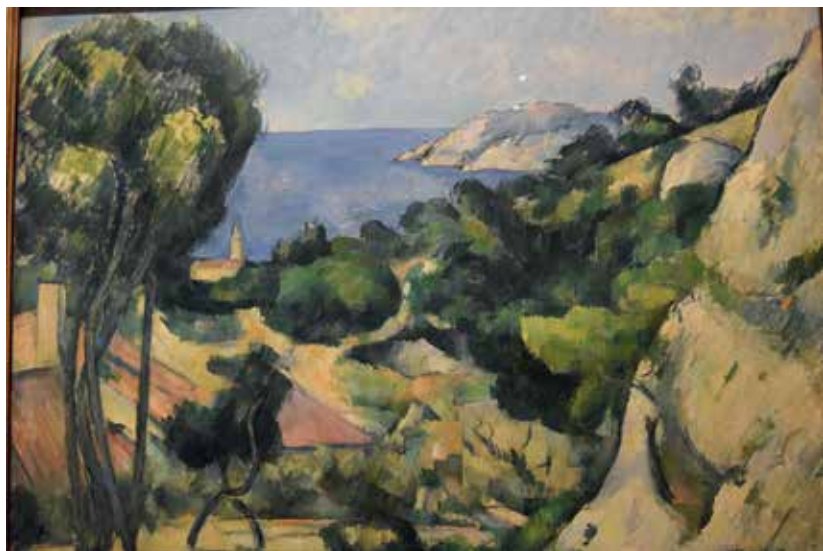
Paul Cézanne: L' Estaque.