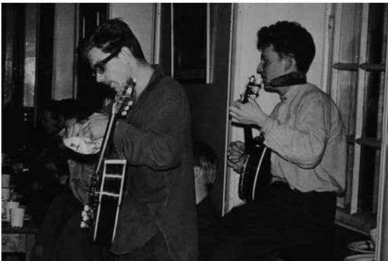
Underhållning för lumparkompisar på S1, Uppsala.

Spelningarna på den tiden var ofta utan gage. Det var så roligt att lira, så gaget var av