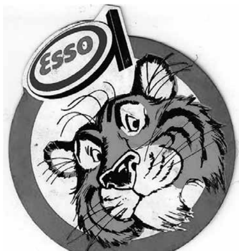
Lyckad reklam på sin tid

Jag gjorde min journalistpraktik på Hallandsposten i Halmstad hösten 1968. På måndagar skickades man ut för att gå på biopremiär. Det fanns naturligt-