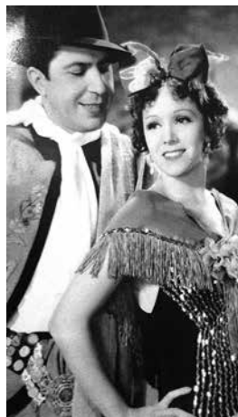
Charm på vita duken.

Det kom aldrig upp i luften. På startbanan kastades musiker- nas plan av den starka vinden mot ett tyskt trafikflygplan som var på väg att landa. Båda maskinerna fattade eld.