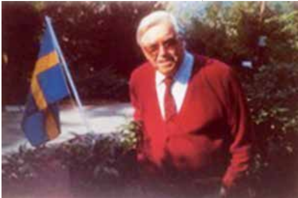
Sven Wahlberg år 1991.