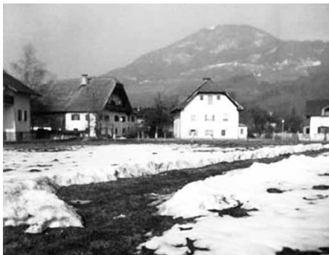
Varnscheins hus i Aigen.

Bilden av huset i Aigen är tagen med en polaroidkamera av Charlotte Herzfeld omkring 1960 och använd som vykort till brodern. Charlotte bodde kvar hos Varnscheins i Salzburg sedan syskonen skingrats – åtminstone till 1915. I bakgrunden syns Gaisberg, 1 287 meter över havet och 568 meter över omkringliggande landskap.