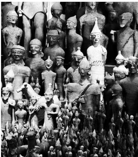
Terrakotta- figurer från Ajia Irini. Krigare i toppiga hjälmor med kindsydd och spetsiga skägg. Tjurar med ormar ringlande uppför halsen. Cirka 625- 500 f. Kr.

Som ung ville jag studera till tavelkonservator, kanske för att jag själv målat sedan barndomen. Kan man inte leva på att måla så kanske man kan försörja sig på att restaurera tavlor som andra har gjort. Men utbildning för en konservator fanns inte i Sverige och det var dyrt att studera