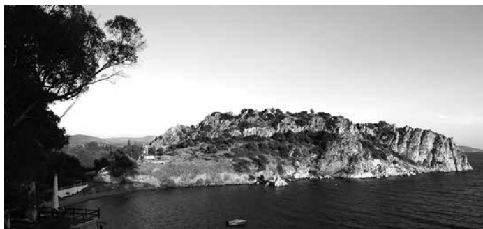
Kastraki, Asines antika akropol eller borgklippa.

Nu bodde arkeologerna hos olika grekiska familjer, alla extremt vänliga, men de kunde naturligtvis inte engelska. Det var nu jag började förstå att man av praktiska skäl bör behärska lite grekiska för kunna arbeta i Grekland. Vår första arbetsdag började med en promenad runt utgrävningarna från 1920-talet. Platsen för det forntida Asine är vackert belägen i en liten bukt på Peloponnesos östra kust. Utsikten över havet och slätten i Argolis var hänförande. På sluttningen av de höga berg som omgav bukten, klängde vingårdar på terrasser. Asine erbjöd oss den mest utsökta arbetsplatsen i världen. Vi strövade genom doftande citron- och apelsinlundar, omgivna av ett hav av röd vallmo. Ett fuktigt dis vilade över de blommande fälten. Skönhet bortom all beskrivning. Vi promenerade på Kastraki, den forntida befolkningens akropol, och snubblade över antika murar och mykenska bosättningar. Allt var övervuxet och täckt med