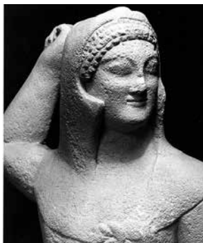
Den cyriotiske guden Melqart-Herakles, statyett i kalksten från Kition. En ung, skägglös gud som svingar sin klubba (nu borta) med höger hand. Han bär lejonsskinnet med tassarna knutna över bröstet och lejonets huvud och tänder synliga över pannan. Ca. 450 f.Kr.

Mitt intresse för bevarande och konservering av antikviteter bara växte när jag fick se Cypernsamlingarna och från början tillbringade jag mycket tid i magasinerna med dess ovärderliga föremål. Jag började gå igenom alla föremål systematiskt tillsammans med en konservator. Ingen hade brytt sig om samlingarna sedan 1940-talet då Alfros var museets förste chef. Ett omfattande projekt påbörjades i samarbete med konservatorerna från Riksantikvarieämbetet. Vi ville åtminstone försöka rädda de berömda kopparvapnen från Lapithos. Större delen av alla svärd och dolkar hade påträffats i en nekropol (begravningsplats) nära Lapithos på Cyperns nordkust där svenskarna grävde ut 23 gravar 1927. Dessa gravar är berömda för sitt överflöd av metallföremål. Vapnen är gjutna i röd arsenikhaltig koppar eller gyllengul brons och de flesta av dem tillverkades omkring 1900-1700 f.Kr. Stora eleganta svärd av röd koppar skimrade mot oss i sina lådor, men de flesta av dem var täckta av korrosion i olika nyanser av grönt, så