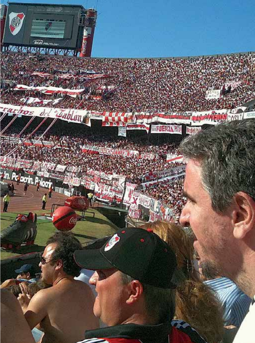
Estadio Monumental - rödvitsvarta River Plates hemmastadion med läktare för nära 60 000. Här vann Argentina fotbolls-VM 1978.