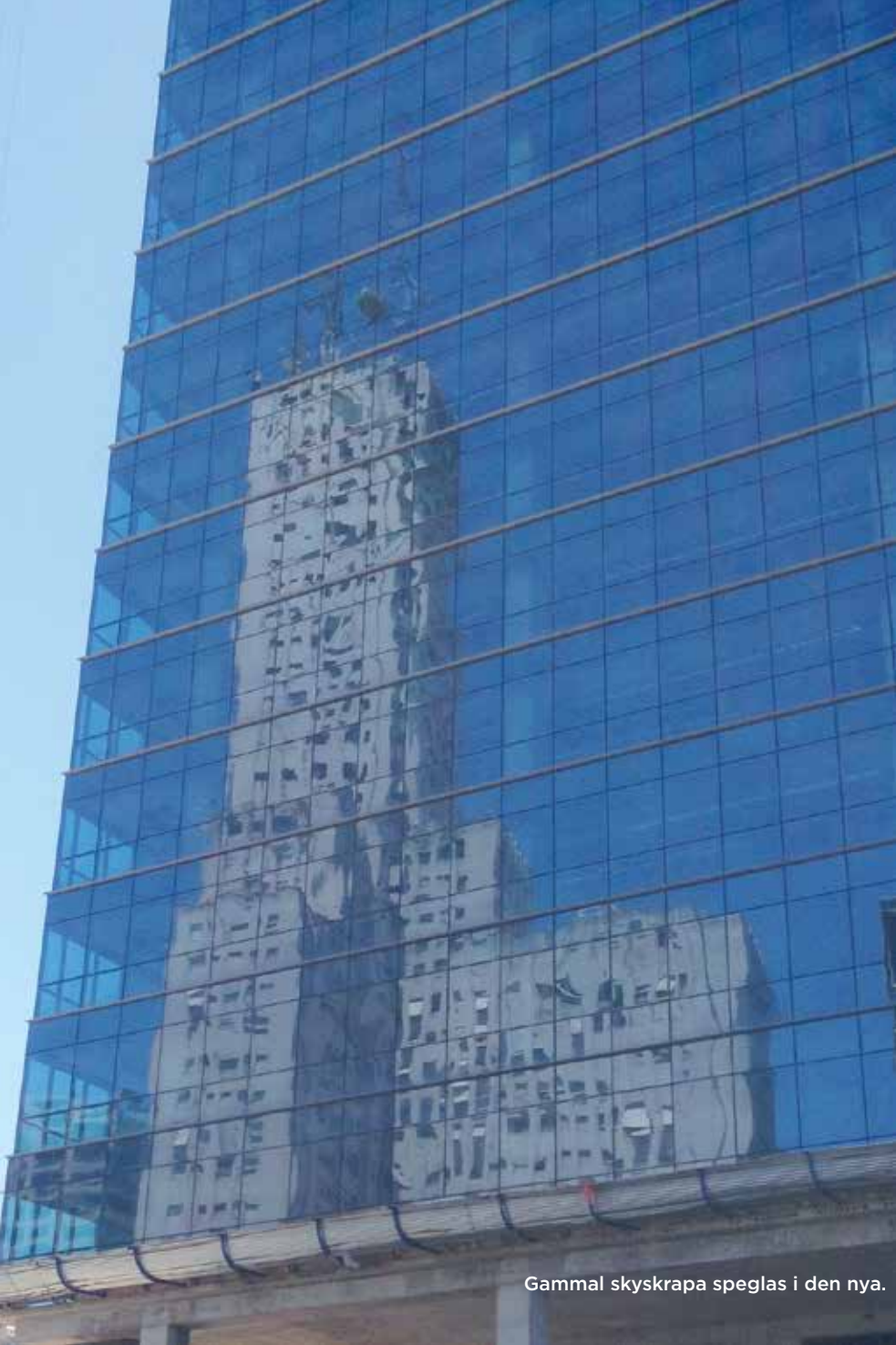
Gammal skyskrapa speglas i den nya.