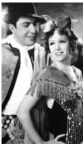
Charm på vita duken.

1931 hade Gardel också mött den brasilianske journalisten och poeten Alfredo Le Pera i Paris. De hade blivit vänner och börjat samarbeta. Le Pera kom att skriva texter till några av de mest berömda av Gardels tangolåtar. Såväl "Mi Buenos Aires querido" och "Por una cabeza" som "Volver" har Le Pera som upphovsman. Många ger brasilianaren äran för att en gång för alla ha höjt ribban för det poetiska innehållet i tangons texter. Inget mer om snabbtåg och hästar med andra ord.