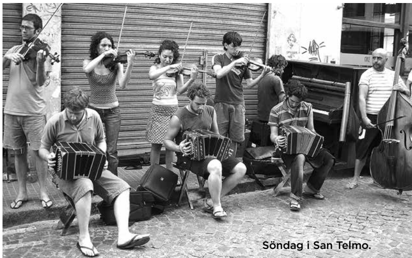
Söndag i San Telmo.