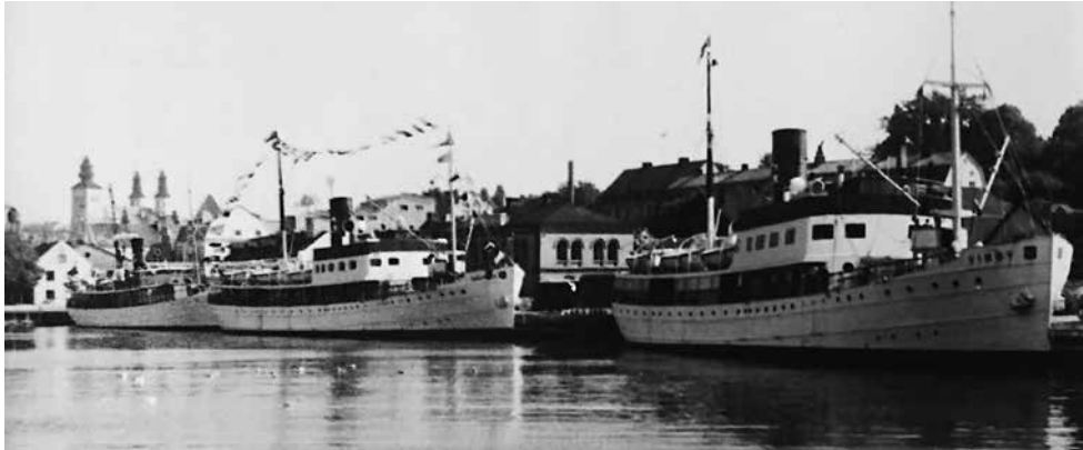
Ovan: Visby hamn. (Ur boken Med båt till Visby )