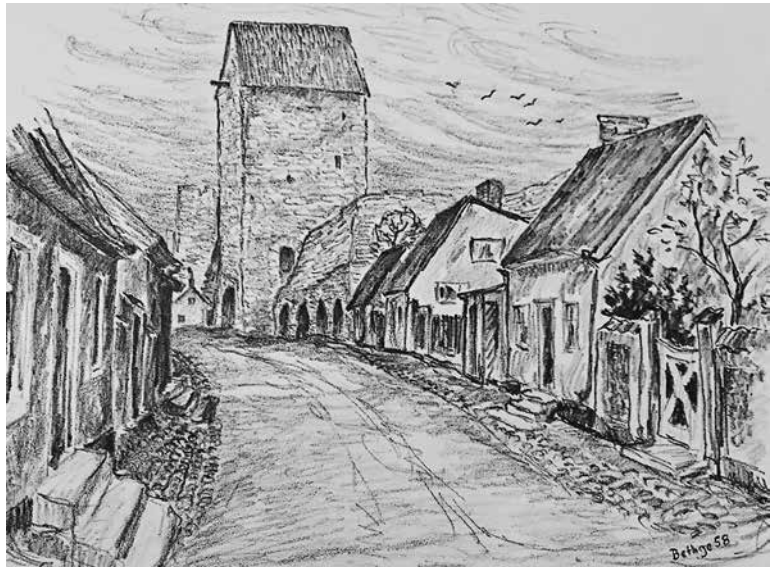
Till höger: Visby. Teckning av Rolf Bethge.