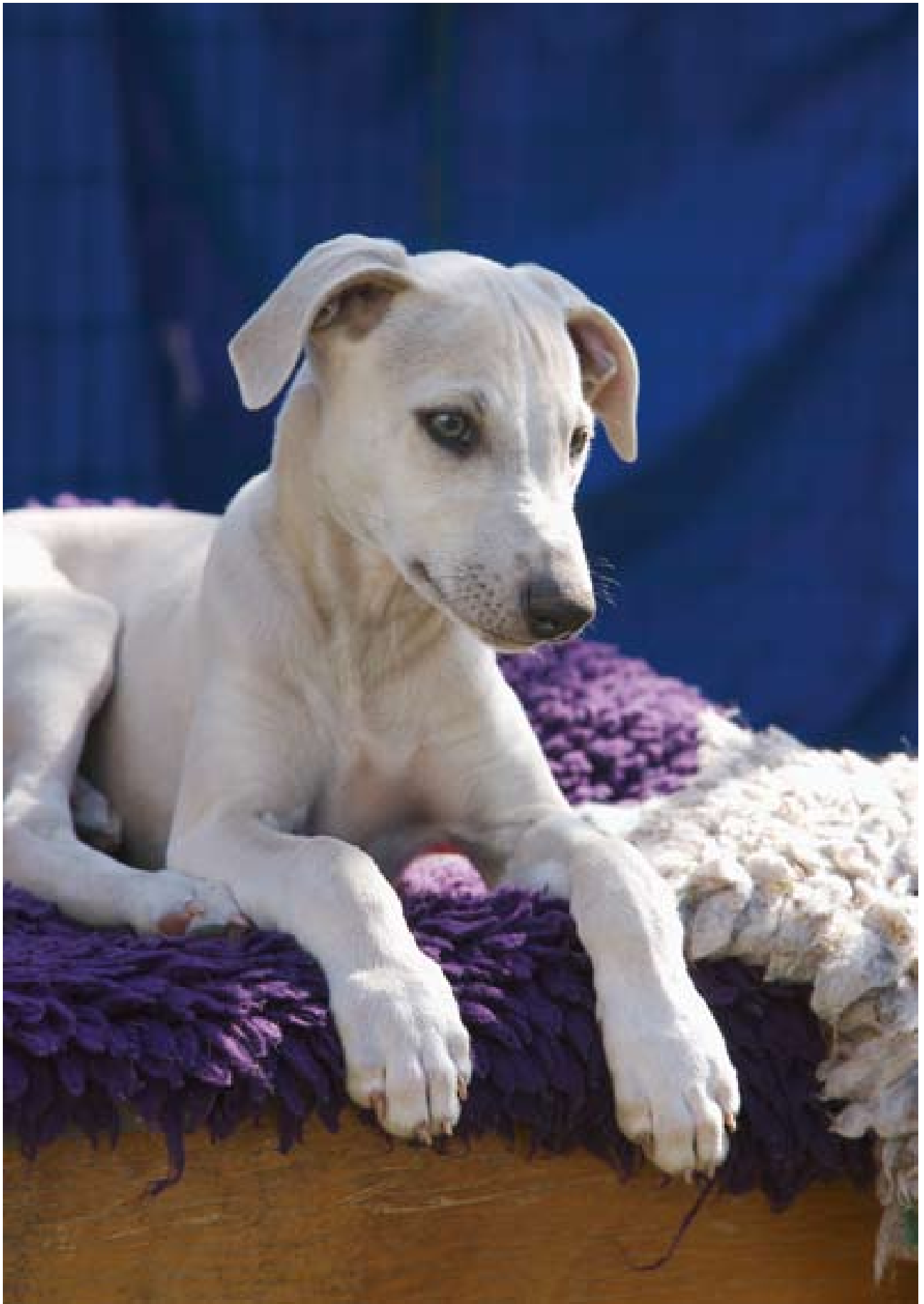
W h i p p e t