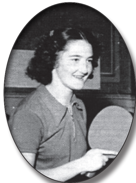
Eina Eriksson blev svensk pingismästarinna och för sedan till USA och blev Eina Dexter.