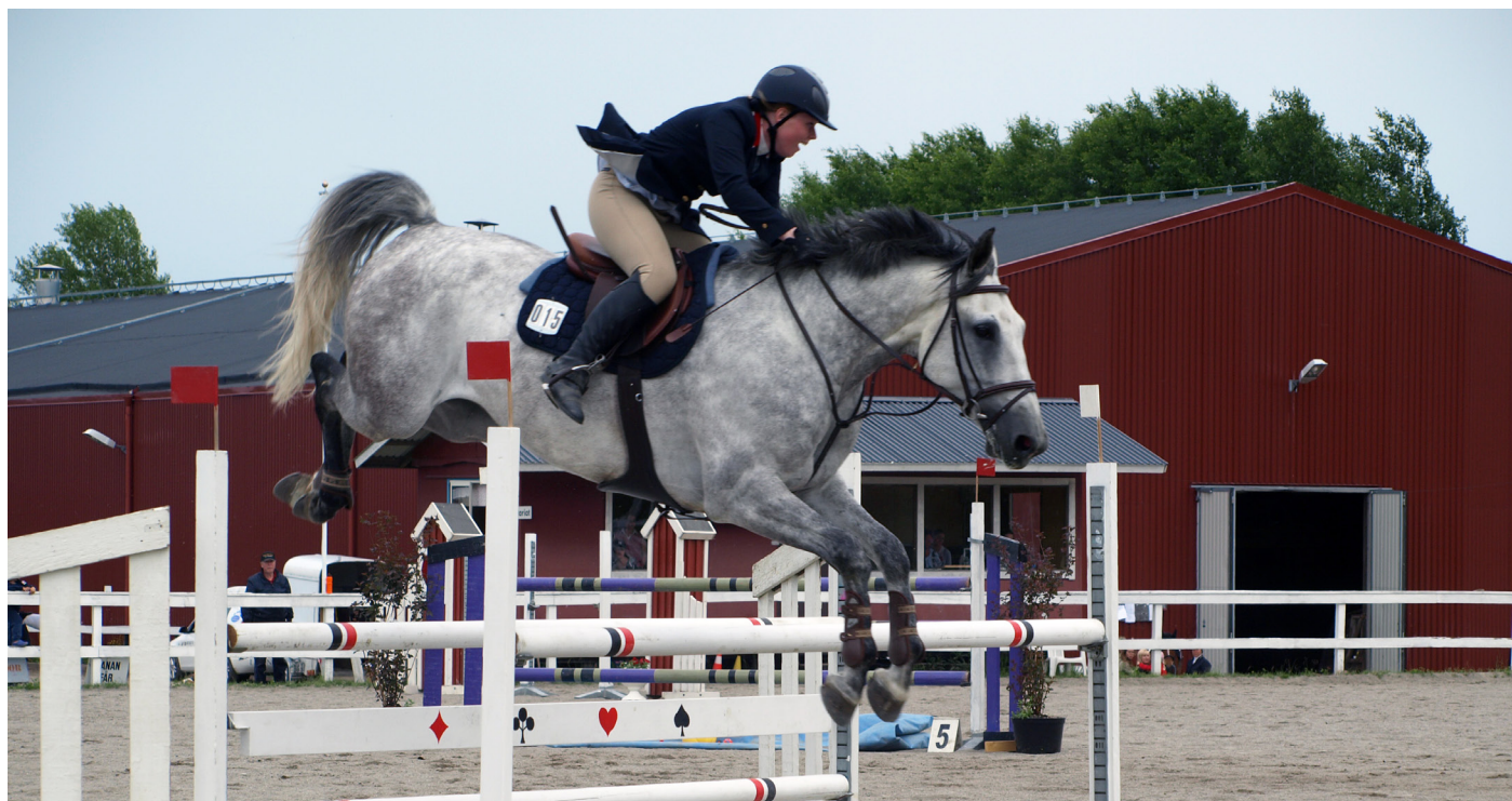
Än i dag, när vi skriver 2013, bedrivs en bred och framgångsrik ridverksamhet ute i Svedjeholmen (Domsjö).