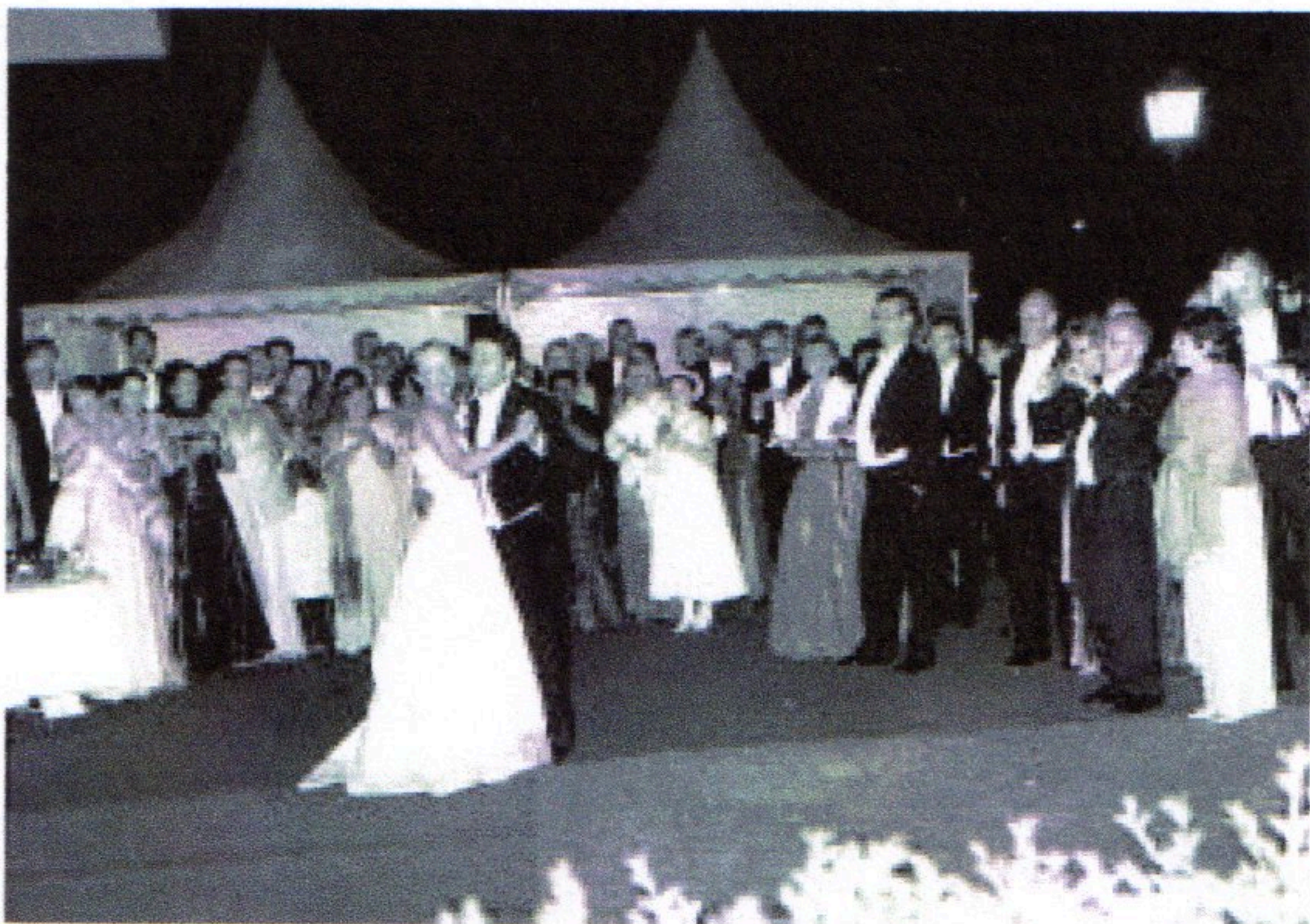
Brudvalsen dansades utomhus under stjärnorna, bruden strålade och vigselringen, som sägs vara en diamant på nästan fyra karat, gnistrade. Ett festklätt storband från Lund spelade.