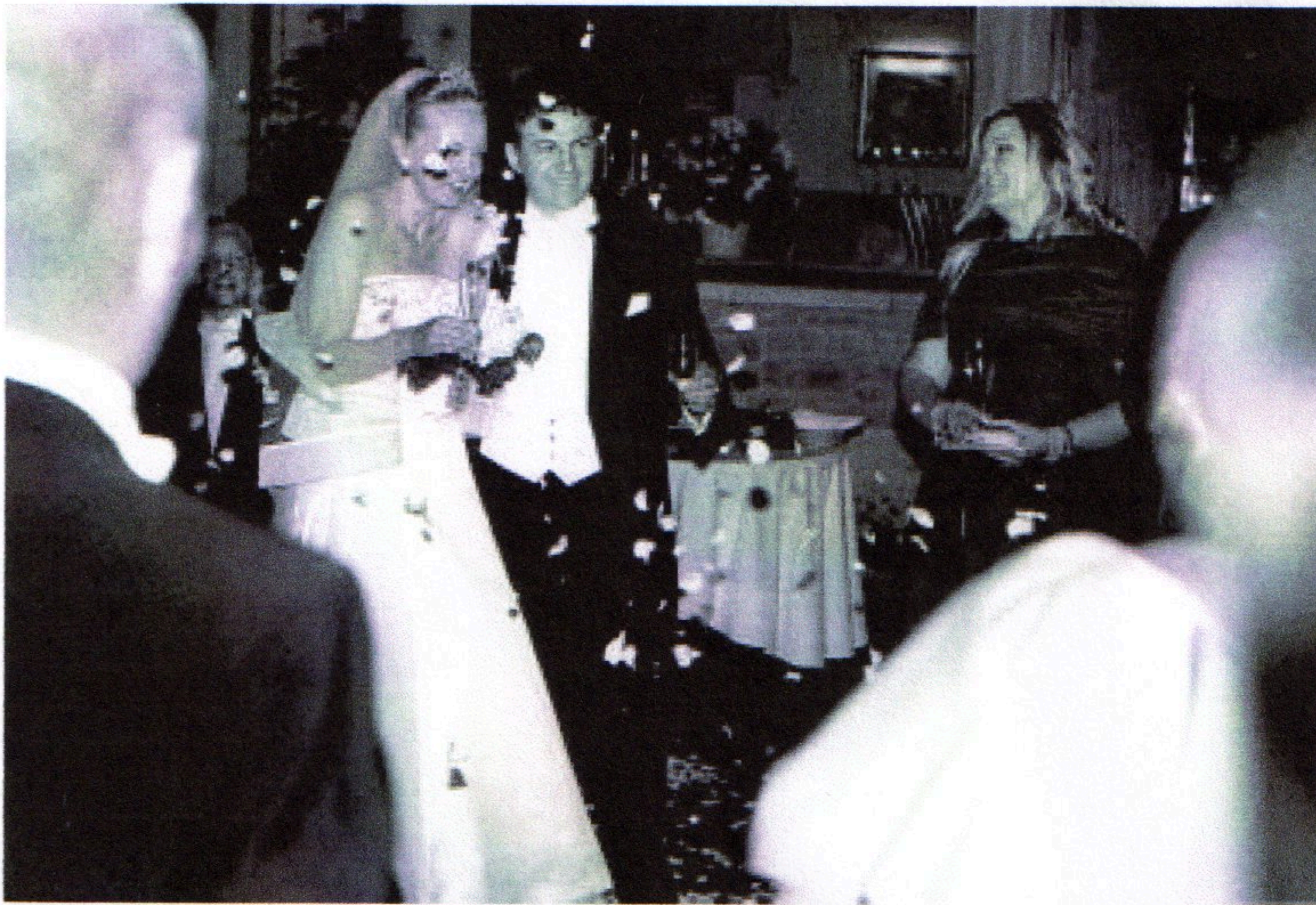
Den drygt en och en halv timme långa vigselakten är över och brudparet har lämnat den smyckade Slottskyrkan, vandrat längs den med 560 marshaller upplysta strandpromenaden till Stadsparksrestaurangen Byttan och hyllas i ett regn av rosenblad.

Till välkomstkålen i champagne, Gula Änkan, serverades bland annat gåsleverpaté i hjärtform och Beluga-kaviar. Det är den absolut mest exklusiva kaviaren som finns och kommer från den ryska Beluga-stören.