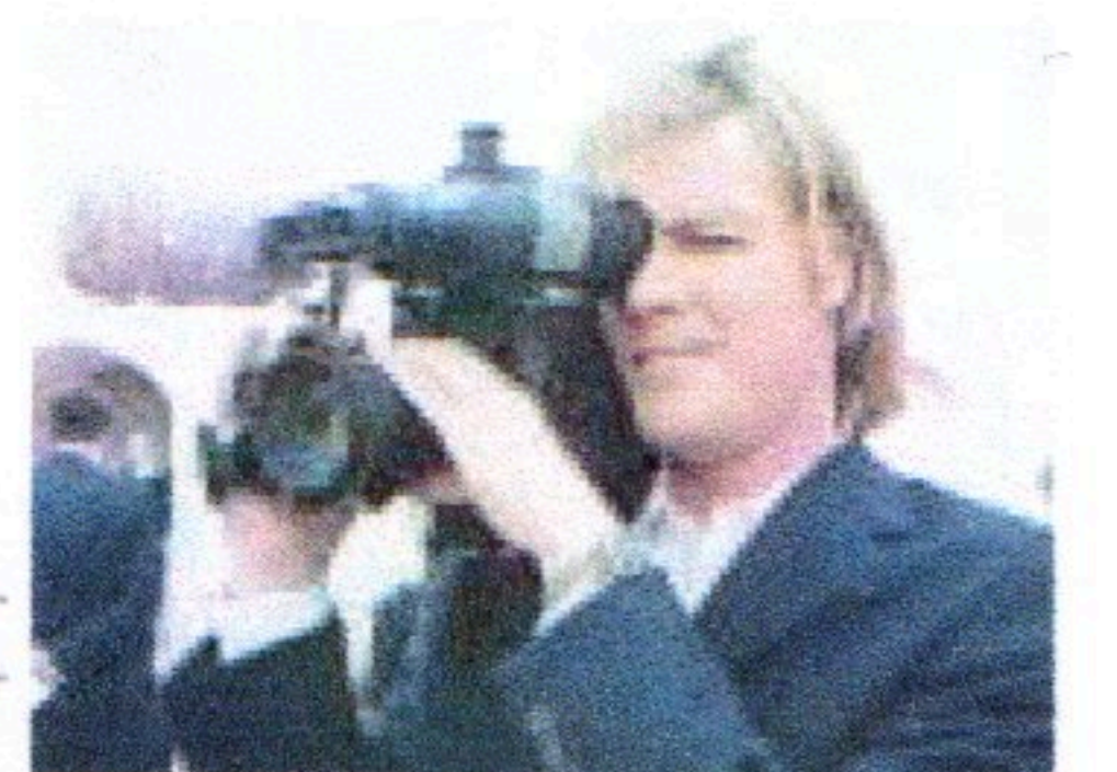
Hela bröllopfesten dokumenterades av professionelle filmaren Janke Liljevall.