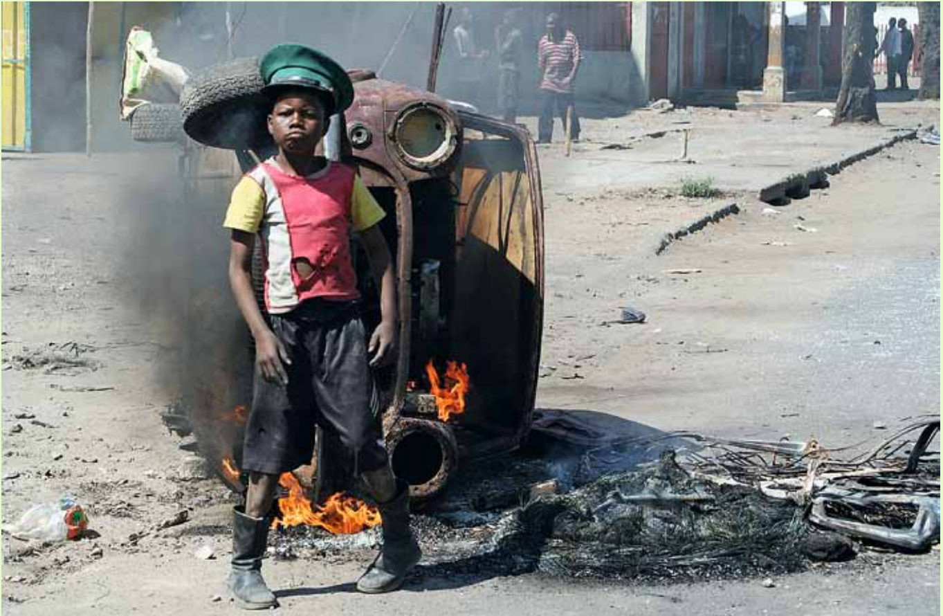
Pojken mitt i Mocambiques upplopp blev en symbol för ilskan över att livet ibland är otroligt orättvist.