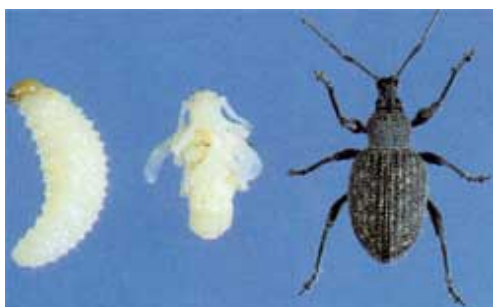
Larv Poppa Öronvivel