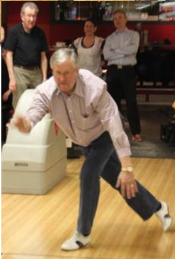
Sköna aktionbilder från årets bowlingtävling mellan de båda Lerumsklubbar. Notera Pigges förtjusning över nyfunna vänner!